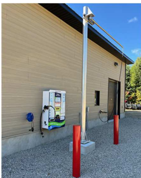
Station de lavage au garage municipal 111, chemin Côté

Veuillez noter que cette carte sera pour votre usage personnel seulement.